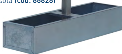
Bussola (cod. 86828)